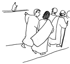
Celui qui n'est pas contre nous est pour nous. Marc 9, 40

Merci Seigneur, pour ta parole qui pacifie nos relations entre croyants, dans nos communautés chrétiennes! Merci Seigneur, pour ta parole qui nous invite à réviser nos jugements sur les incroyants et ceux qui ne font pas partie de nos groupes. Merci Seigneur pour ta parole qui nous interroge sur nos comportements pour que notre témoignage soit toujours vrai ! Pierre Ruchot édité dans la revue « Feu nouveau ».