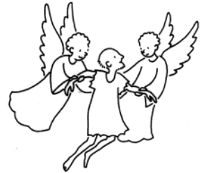
Les anges emportèrent Lazare auprès d'Abraham. Luc 16, 22

Il nous a tracé la route sûre pour qu'à notre tour, nous nous investissions dans notre monde !