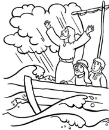
Jesus did amazing things because he is the Son of God.

Réveillez le Christ ! : Quelquefois, on a l'impression que le Christ dort (image de sa mort) et qu'il est indifférent à ce que nous vivons. Le réveillons-nous assez ? Ou plutôt, est-ce que notre foi en lui est éveillée ? Ne nous arrive-t-il pas trop souvent de laisser le Christ dormir dans notre vie ? Notre foi est-elle vivante ? N'oublions pas qu'il s'est levé (image de sa résurrection) dans la barque et qu'il a calmé la mer, la tempête. Sa mort et sa résurrection, voilà le centre de notre foi ! Avec lui, dans notre barque, n'ayons crainte de passer sur l'autre rive. Faisons monter le Christ dans la barque de nos vies pour passer avec lui de la peur à la confiance, de notre vie stagnante à une vie nouvelle ! Ne pas oublier de faire monter le Christ dans la barque de nos vies pour passer avec lui de la peur à la confiance, de notre vie stagnante à une vie nouvelle !