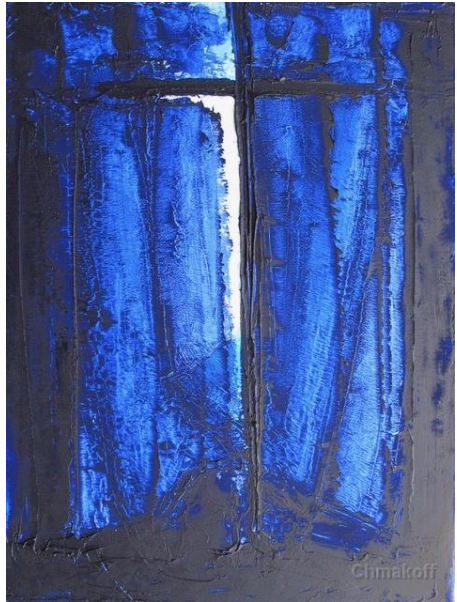
Macha Chmakoff, Traversée de la nuit (81x65)

Quel est cet amoureux Au lieu-dit Diable est mort, Sur la grève aux poissons,