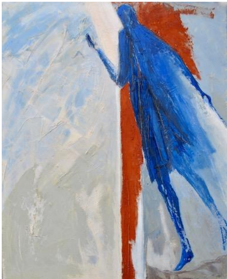
Macha Chmakoff, « Il n'est pas ici, il est ressuscité » (81x65)