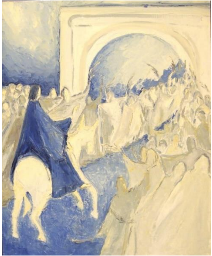
Macha Chmakoff, L'entrée à Jérusalem n° 2 (81x65)

3. Vos rues se drapent de manteaux jetés sur mon passage : Hosanna ! Béni sois-tu, Seigneur ! Pourquoi souillerez-vous mon corps de pourpre et de crachats, mon corps livré ?