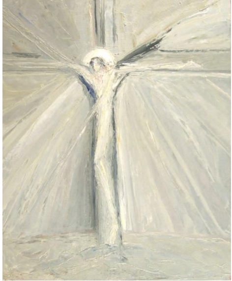
Macha Chmakoff, Tout est accompli (81x65)

Vous n'aurez pas compris la beauté du message Que je vous apportais en frémissant de joie Vous n'aurez pas compris, vous croirez être sages En clouant la sagesse au gibet de la croix. Et vous proclamerez toute la paix du monde En faisant retentir les cris de votre orgueil. Et vous vous en irez, pour conquérir le monde, Mais vous n'y sèmerez que la ruine et le deuil.