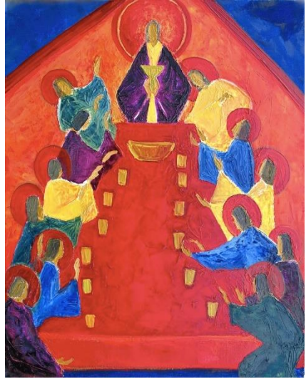
Macha Chmakoff, La Cène (81x65)

Un jour, tu nous prendras à la table de Dieu.