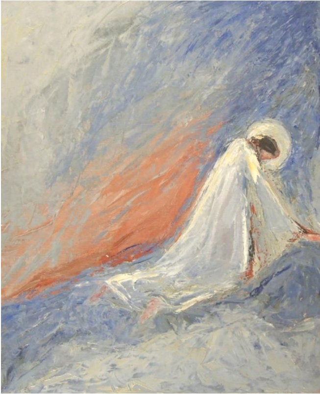
Macha Chmakoff, Gethsémani n°3 (81x65)

Pour prier la Semaine Sainte en temps de confinement... Semaine Sainte 2020