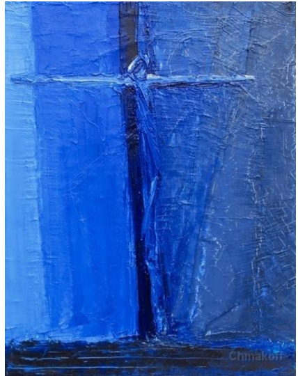
Macha Chmakoff, Traversée de la nuit (40x50)

Quand on a cloué au bois L'homme-Dieu, Quand on a dressé l'amour sur la croix, On attendait ce jour-là Que s'ouvre le ciel. R/ Le ciel n'a pas répondu, La prière s'est perdue Dans la nuit.