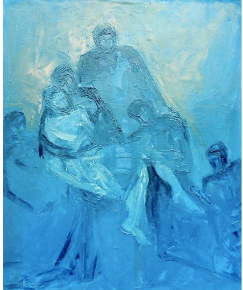
Macha Chmakoff, Descente de croix n°2 (81x65)

Voyez : le blé en herbe Surgit de vos labours. Bientôt deviendra gerbes, Demain cuira au four.